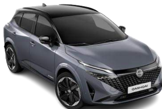
Szary ceramiczny + czarny dach - XCX 6 000 zł