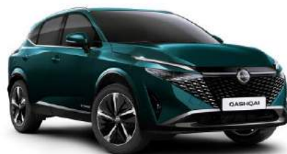
Deep Ocean - FAP 3 000 zł