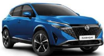
Niebieski - RCF Bez dopłaty