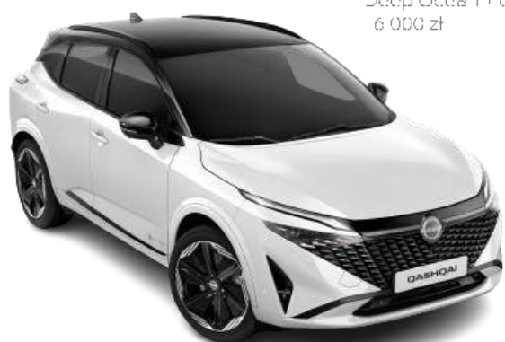
Biały perłowy + czarny dach - XK. 6 000 zł