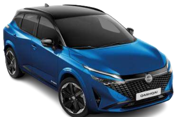
Niebieski + czarny dach - XCZ 6 000 zł