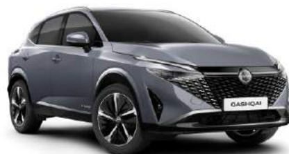
Szary ceram czny - <BY 3 000 zł