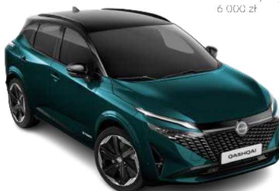
Deep Ocean + czarny dach - YBJ 6 000 zł