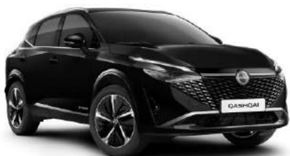
Czarny perłowy - CAT 3 000 zł