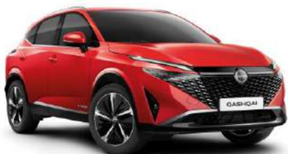
Czerwony Fuji Sunset - NBV 3 000 zł