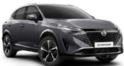
Szary - <AD 3 000 zł