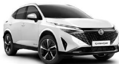
Biały perłowy - QBE 3 000 zł