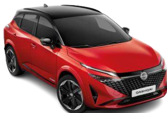
Czerwony Fuji Sunset + czarny dach - YAU 6 000 zł