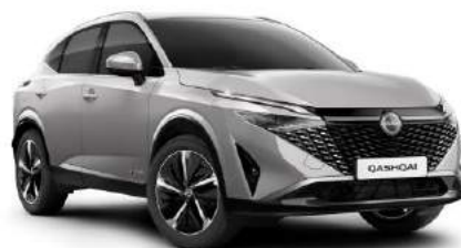
Srebrny - <Y0 3 000 zł