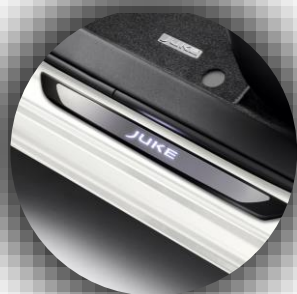
Podświetlane nakładki progów