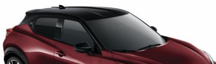
XDQ BURGUNDOWY + CZARNY DACH