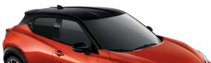
YAU CZERWONY „FUJI SUNSET” + CZARNY DACH